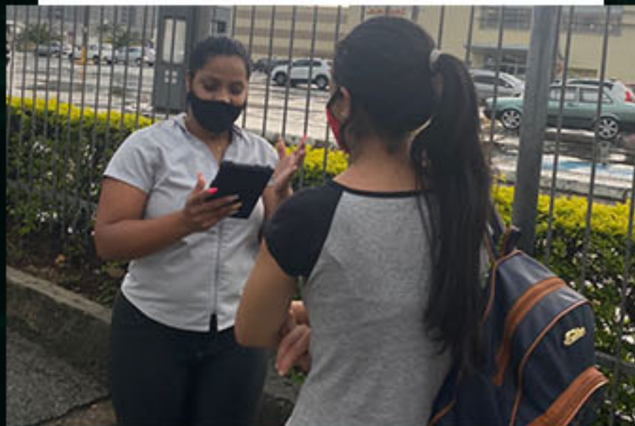
Dia das Mães