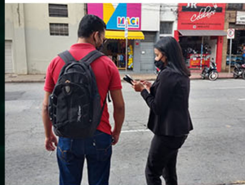
Dia dos Namorados