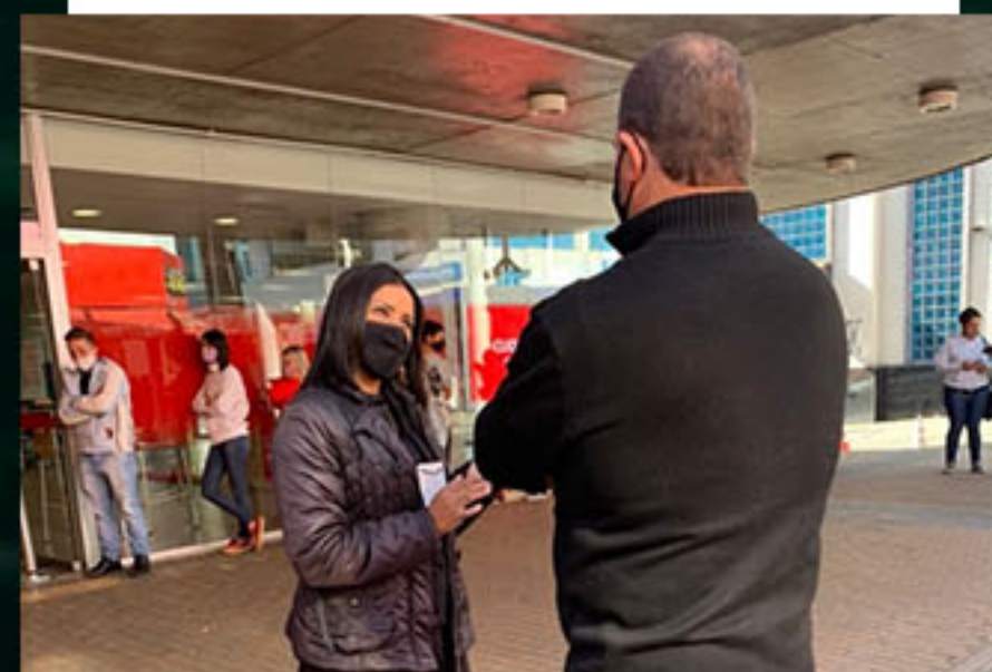
Dia dos Pais