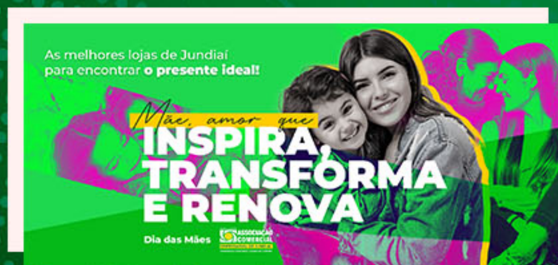
Dia das Mães

Outras datas - Ao longo de 2021, nas principais datas para o varejo, a Associação Comercial realizou campanhas para divulgar e apoiar lojas associadas. A ACE criou páginas específicas para cada data, com o nome das empresas, divididas por segmentos, e ao clicar no ícone de cada loja, o consumidor era direcionado para o número de WhatsApp do estabelecimento, o que facilitava o contato com os associados. A página foi divulgada em todos os canais de divulgação da ACE e na mídia local.