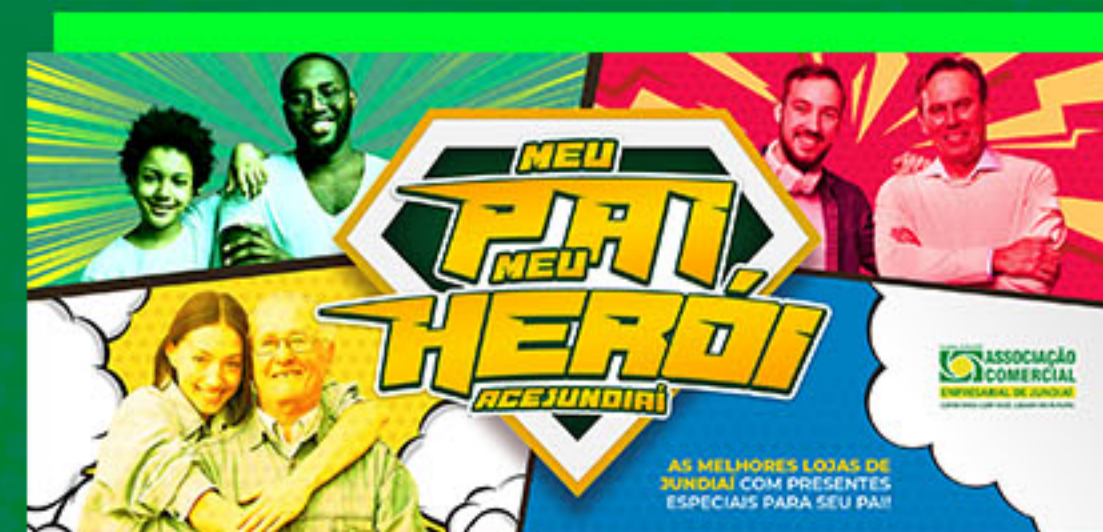
Dia dos Pais