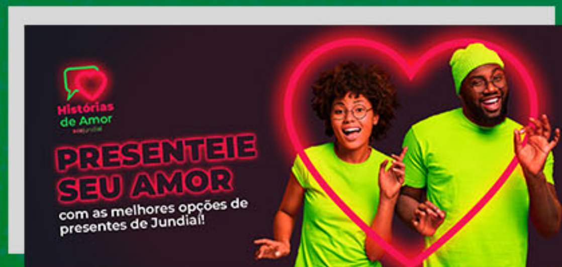
Dia dos Namorados