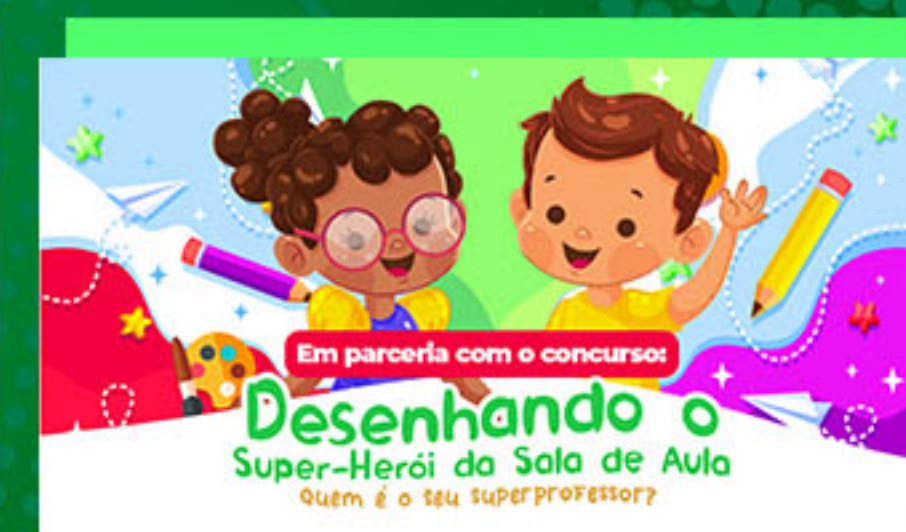
Dia das Crianças